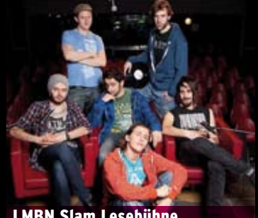
LMBN Slam Lesebühne